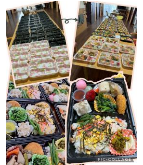
合計 45 食の手 作り弁当は圧巻

今年の春はとにかくお出かけしまくりました。お弁当を作って、耳原公園にお花見に行くのは何と 5 年ぶり！桜は、弁天さんや水尾公園にも行きました。ドライブに行く時は、マクドナルドのドライブスルーでソフトクリームかシェイクを購入。皆さんとっても喜ばれます。6 月には 1 年ぶりのはま寿司ツアーに、大好評でした。6 月末まで入場料無料だったので、ほぼ全員安威川ダムパークに行きました。