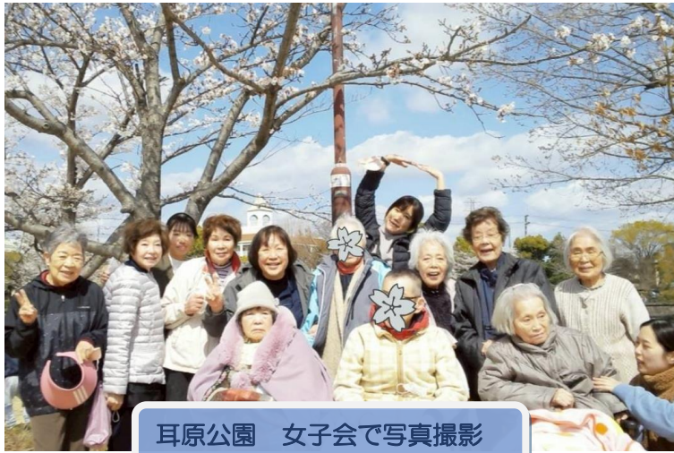
耳原公園 女子会で写真撮影