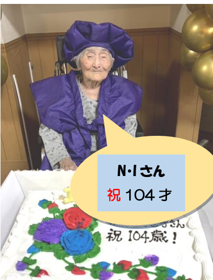
N-Iさん 祝 104 才