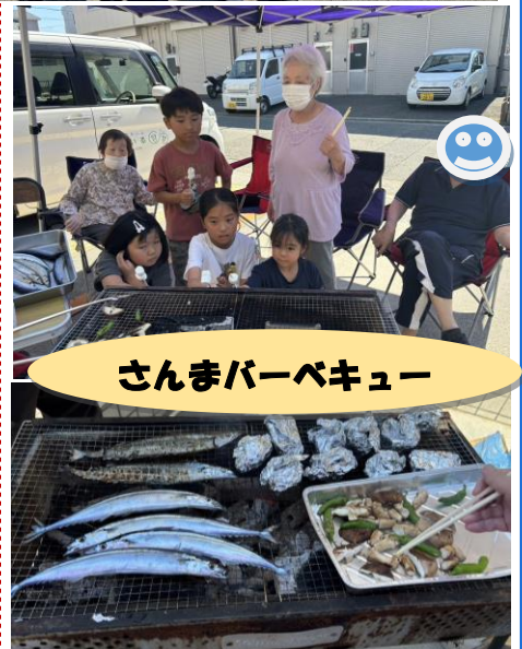
さんまバーベキュー